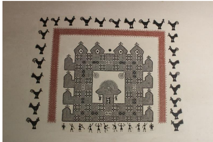
ಚಿತ್ರ 3: ಗೋಡೆ ಚಿತ್ತಾರದ ಸಮಗ್ರ ಸೊಬಗು

ಚಿತ್ತಾರ ಕಲೆಯನ್ನು ಎರಡು ವಿಧಗಳಲ್ಲಿ ಕಣ್ತುಂಬಿಕೊಳ್ಳಬಹುದು. ನಿತ್ಯಜೀವನದ ವಿವಿಧ ಸಂದರ್ಭಗಳಲ್ಲೆಲ್ಲಾ ಚಿತ್ತಾರದ ಭಿತ್ತಿ ಪ್ರಾಮುಖ್ಯತೆ ಪಡೆದರೆ, ಮದುವೆ, ನಾಮಕರಣ, ಹಬ್ಬ, ಆರಾಧನಾ ಮಹೋತ್ಸವ ಮತ್ತಿತರ ಅವಧಿಗಳಲ್ಲಿ 'ಹಸೆ ಚಿತ್ತಾರ' ಪ್ರಕಾರಕ್ಕೆ ಆದ್ಯತೆ ದೊರೆಯುತ್ತದೆ. ಚಿತ್ತಾರ ಕಲೆಯ ಮೂಲಕ ಪ್ರಾಕೃತಿಕ ಸೊಗಡು ಮತ್ತು ಪ್ರಾಕೃತಿಕ ಬದಲಾವಣೆಗಳನ್ನೆಲ್ಲಾ ಹಿಡಿದಿಡಬಹುದು. ಗೋಡೆಮೇಲಿನ ಚಿತ್ತಾರವು (ಚಿತ್ರ 3)ಚಿಗುರು, ಎಲೆ, ಪತಂಗ, ಕೋಳಿ, ಹಕ್ಕಿ, ಮದುವೆ ದಿಬ್ಬಣದ ವಿವಿಧ ಬಗೆಯ ಚಿತ್ರಣಗಳನ್ನು ಕಟ್ಟಿಕೊಟ್ಟು ಆ ಮೂಲಕ ಪ್ರಕೃತಿ ಮತ್ತು ಬದುಕಿನ ನಡುವಿನ ಕರುಳುಬಳ್ಳಿಯ ಸಂಬಂಧವನ್ನು ಅನಾವರಣಗೊಳಿಸುತ್ತದೆ.